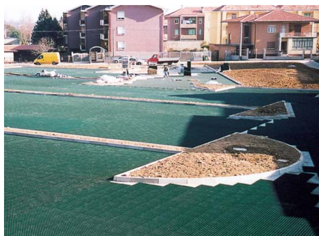
Posa del grigliato in prossimità dei cordoli.