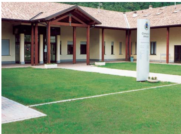
Posa di guttagarden® per area pedonale e carrale prima e dopo la crescita dell'erba.