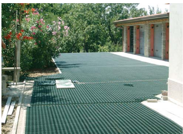
Posa di guttagarden® in un parcheggio ad uso privato.