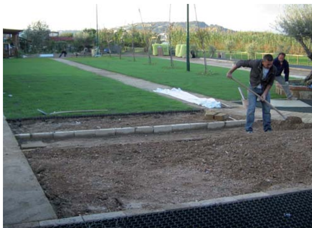
Posa di guttagarden® in un parcheggio.